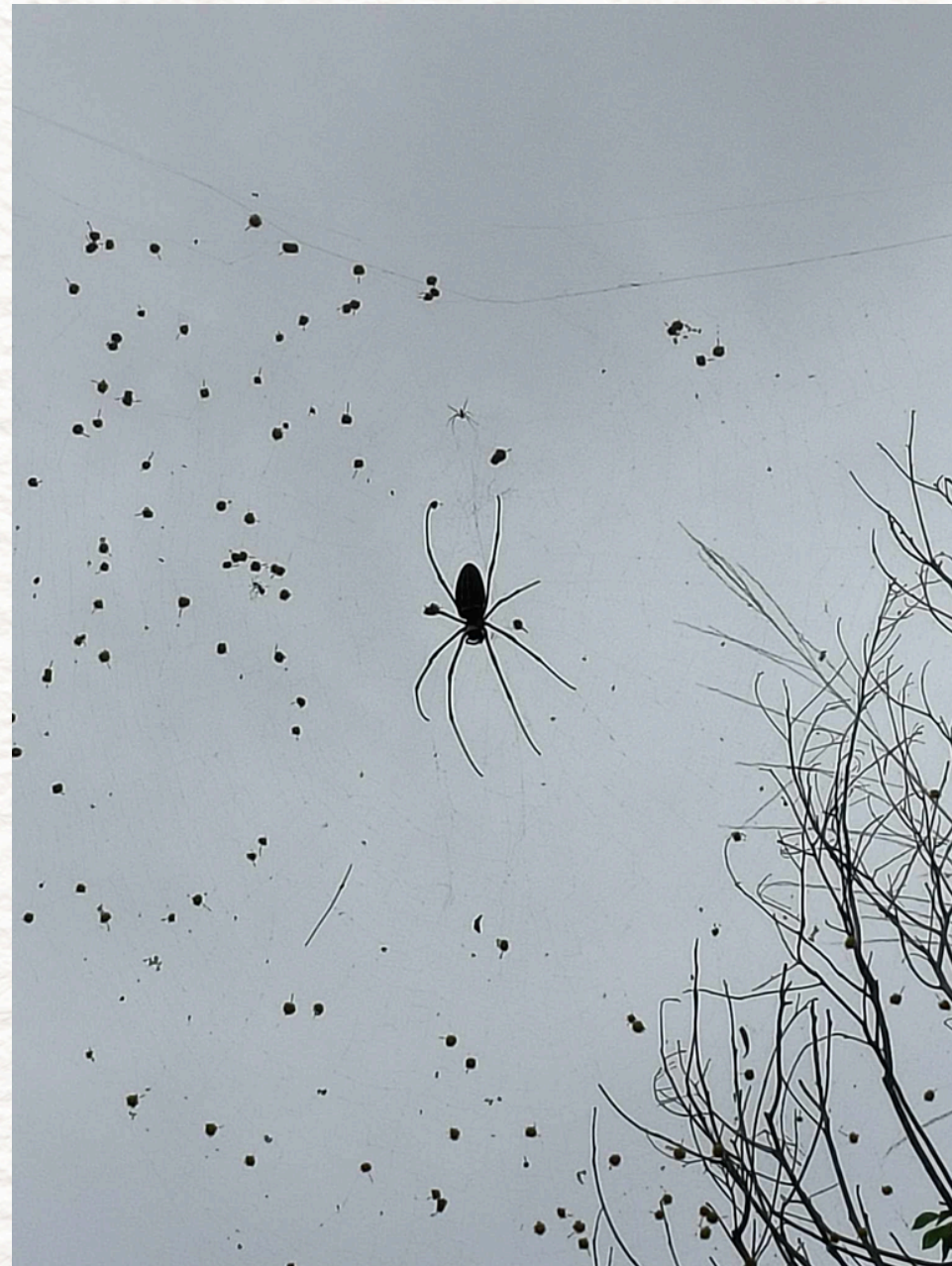
在樹枝間結網的人面蜘蛛