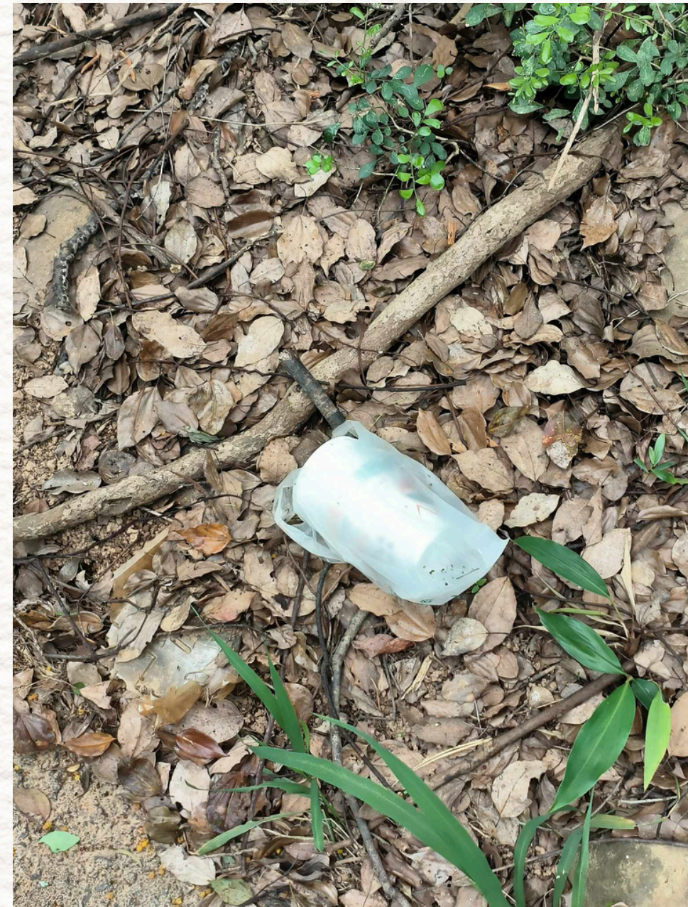
沿路看到許多人造垃圾 被丟棄在路邊